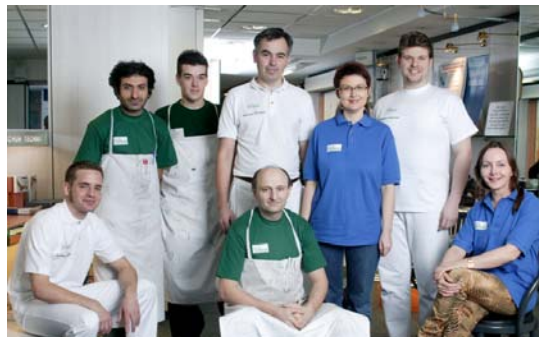
Das Winkler Team