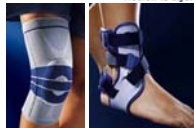
Malleotrain, Genutrain, Viscospot, Airloc, Valculoc